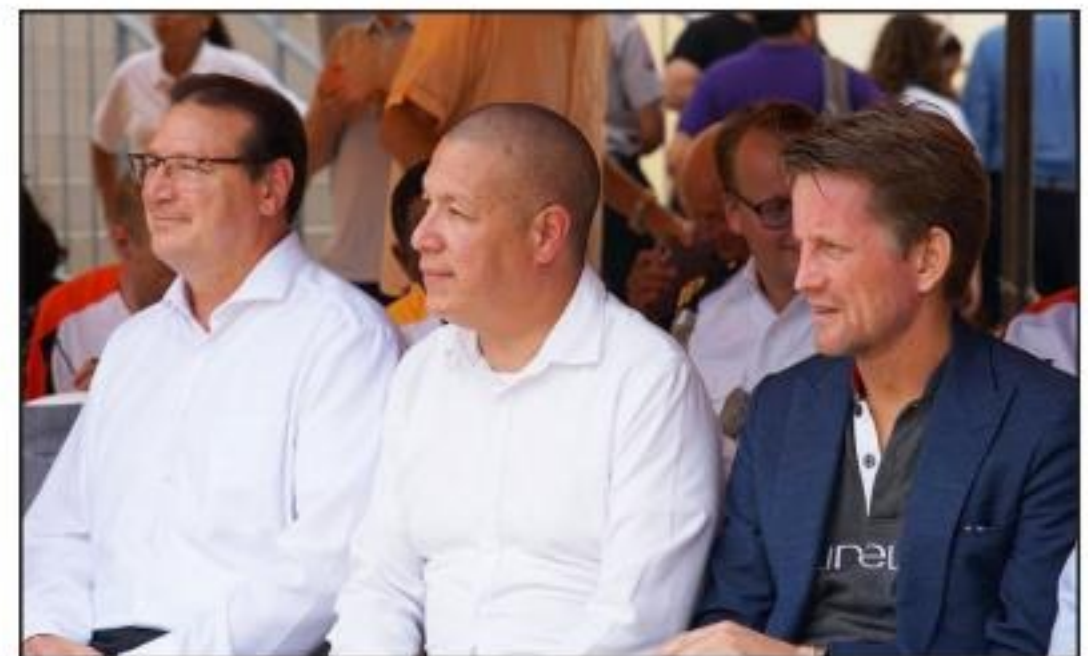
Deportivo Frans Figaroa pa weganan di futbol.

Tambe Wichi y Ty a presenta algun di nan cancionnan E weganan ta sigui henter e siman aki tanto na Compleho Deportivo Crismo Angela/Nadi Croes pa baseball y na Compleho